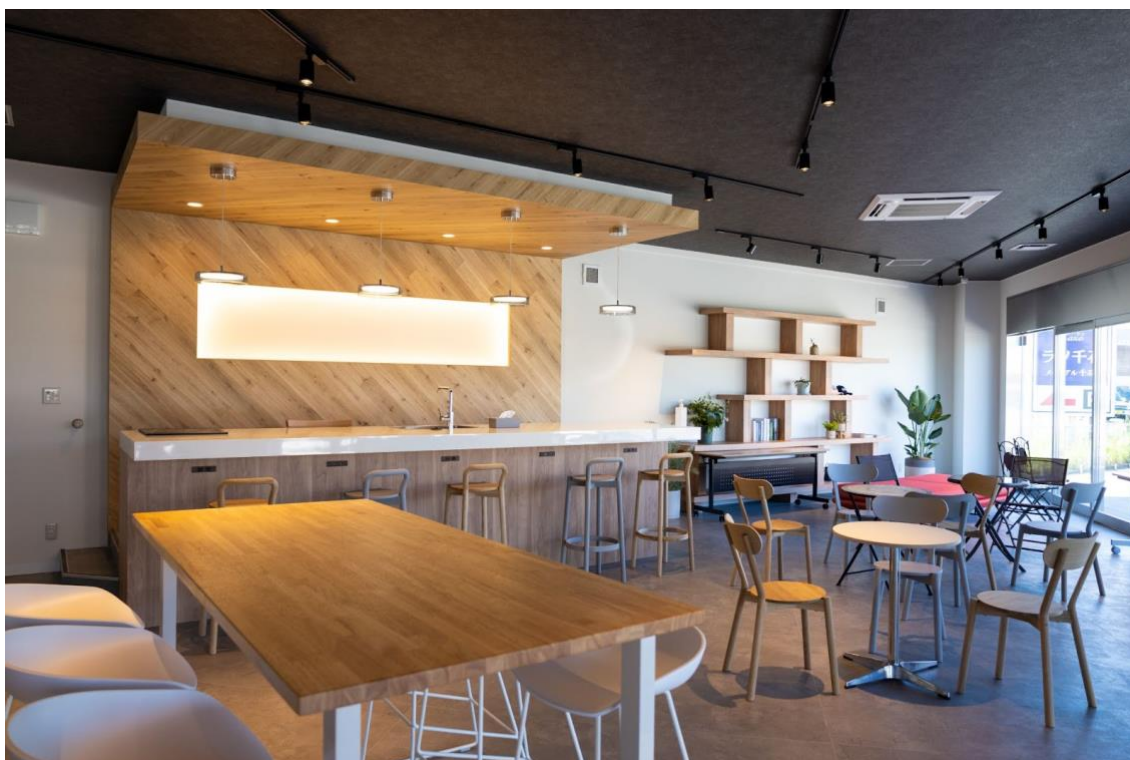
コミュニケーションを促進するカフェラウンジ